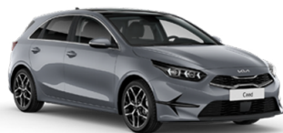
Lunar Silver [CSS]