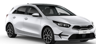
Deluxe White [HW2]