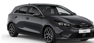
Dark Penta Metal [H8G]