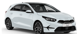
Casa White* [WD]