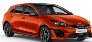
Orange Fusion [RNG]

Доплата за металик боја: 500 EUR (30.900 МКД) * Бојата Casa White е неметалик