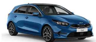
Blue Flame [B3L]