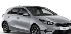
Sparkling Silver [KCS]