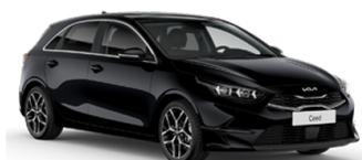
Black Pearl [1K]