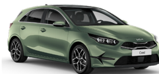
Experience Green [EXG]